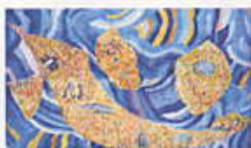
標題 「宇宙と心」 タイル壁画 4.3×3.0m 2000年制作 個人蔵

約十万余個の色タイ ルで制作された壁画。パ ックは水を表わし「心」 の大文字の中に太陽、地 球、星など宇宙と世界、 ノアの箱舟まで入って いる。水は作者のテーマ らしく、生命の神秘を象 徴する。壮大な宇宙、世 界も入ってしまう心の 広大と生命の神秘。